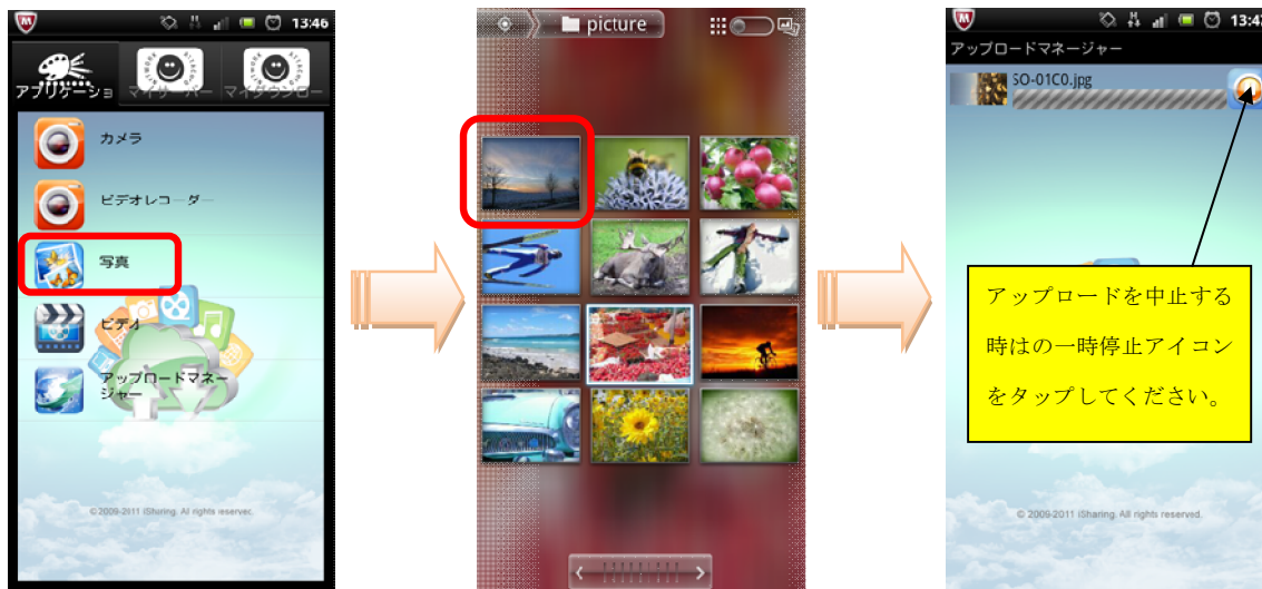
(画面は Xperia Arc のギャラリー)

CloudSync の「アプリケーション」画面にある「写真」「ビデオ」はスマートフォンに保存されている写真や動画を RockDisk にアップロードする機能です。アップロードするファイルを選択する際は、スマートフォンの写真・動画管理アプリと連動します。連動するカメラアプリはスマートフォンの機種によって異なります。ここでは XperiaArc のカメラアプリを例にご説明します。